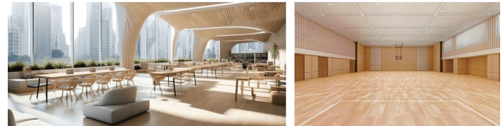
Кампус STATION в Шібуя ※ кампус знаходиться біля станції Шібуя