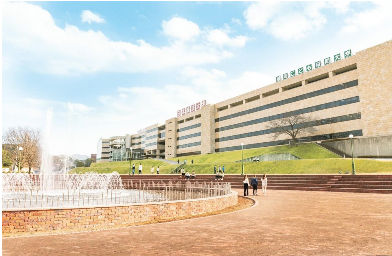
Кампус в м.Фукуока

існує вже 57 років. Кампуси знаходяться в м. Фукуока, м. Кобе і м. Шібуя, з приблизною кількістю учнів 6000