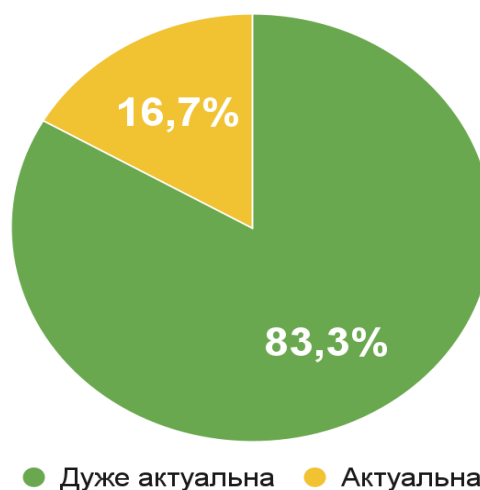
Рис. 1. Результати оцінювання актуальності освітньої програми «Мова і література (китайська)» роботодавцями (у %)