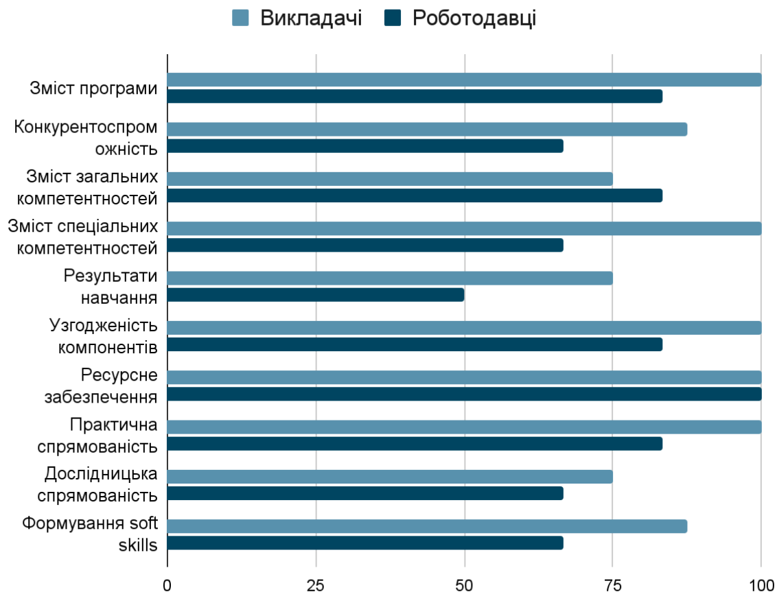
Рис. 4. Оцінювання змістової складової за параметрами освітньо-професійної програми 035.065.01 «Мова і література (китайська)» викладачами та роботодавцями

Результати оцінювання дають змогу узагальнити наступне.